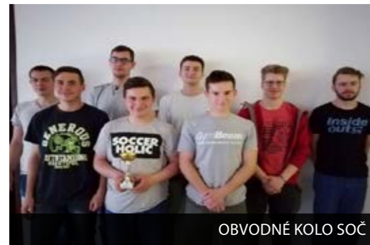
OBVODNÉ KOLO SOČ