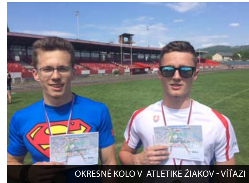
OKRESNÉ KOLO V ATLETIKE ŽIAKOV - VÍŤAZI