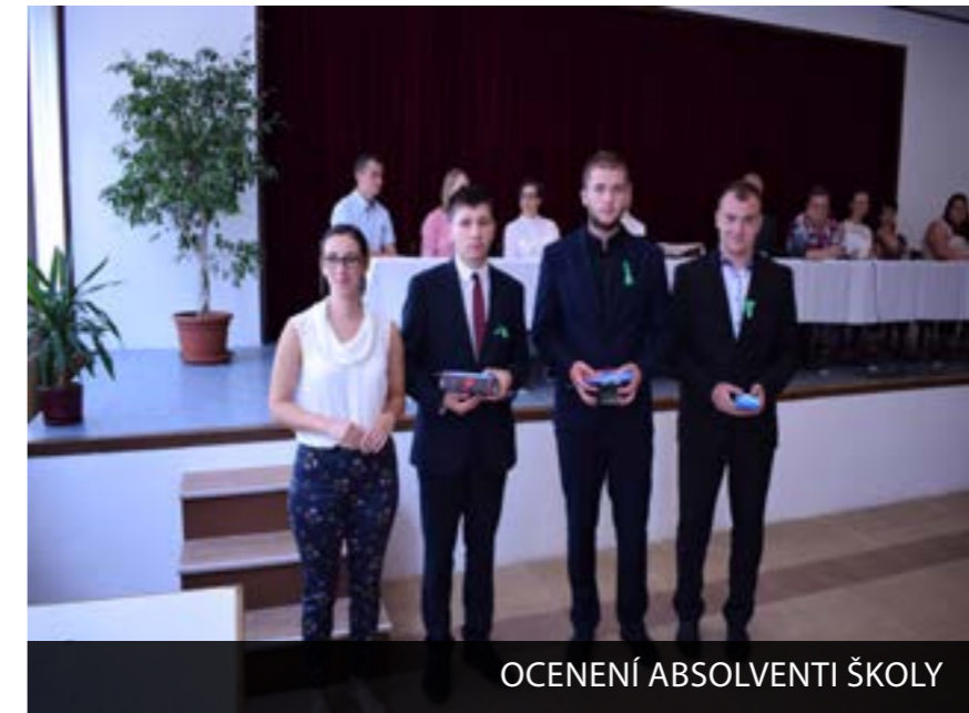
OCENENÍ ABSOLVENTI ŠKOLY