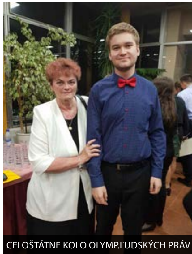
CELOŠTÁTNE KOLO OLYMP.ĽUDSKÝCH PRÁV